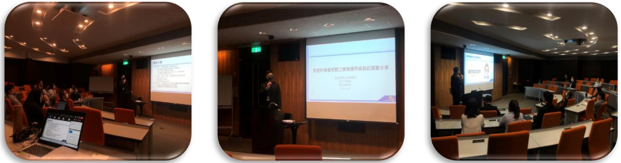
圖四、「智慧財產權管理」講座

「智慧財產權之概要與佈局」、「商標、專利、及營業秘密之訴訟攻防」、「工程履約所涉之智財保護與智財侵權議題」等智財管理的觀念及實務上相關訴訟攻防的案例，並特別檢視中鼎公司 NDA 並提出建議，讓我們可以藉由吸收這些觀念及經驗，來尋求精進的機會。講座採實體及線上同步辦理，參與講座的同仁包含專案、業務、直屬單位、法務、合約等部門主管或同仁共計 38 位主管/同仁(教室 16 人、線上 22 人)，詳圖四。