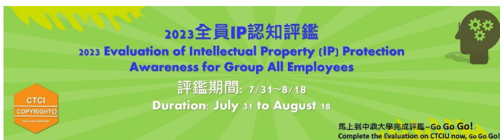
圖三、「2023 集團全員智慧財產(IP)認知評鑑」EIP Banner 宣導

112 年「集團全員智慧財產(IP)認知評鑑」，評鑑內容依發行之相關準則及權責分為「主管版」及「同仁版」。主管版分別就「準則/程序要求」、「主管權責」及「主管易疏忽事項」等重點進行評鑑，同仁版則以「準則/程序要求」及「同仁常犯之缺失」等臚列為評鑑要點。今年度的集團全員 IP 認知評鑑已經順利地在第三季辦理完成。