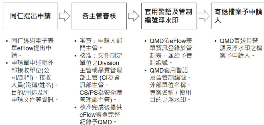
圖二、對外提供文件管控作業要求

往年公司在對內文件的管控上已逐漸建立完善的管理機制，今年我們針對提供給外部單位的保密文件進一步建立管控機制，詳圖二。各需求單位透過申請，取得加上管制編號及浮水印的文件提供給外部單位，以達到管制及追溯的目的。相關機制並將納入「CP-104 保密文件管理準則」的作業要求中。